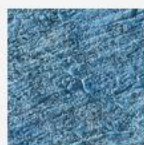
3D Granit bleu