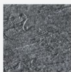
3D Granit gris