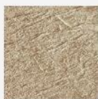
3D Granit sable

En résumé : la collection « Xtra » de DEL, ce sont au total 4 motifs de liner effet pierre pour un bassin qui se marie parfaitement à la tendance actuelle et qui saura s'intégrer harmonieusement à tous les types d'extérieurs.