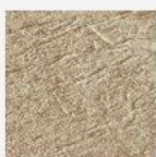
3D Granit sable

En résumé : la collection « Xtra » de DEL, ce sont au total 4 motifs de liner effet pierre pour un bassin qui se marie parfaitement à la tendance actuelle et qui saura s'intégrer harmonieusement à tous les types d'extérieurs.