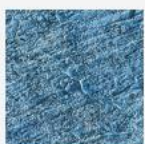
3D Granit bleu