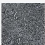
3D Granit gris